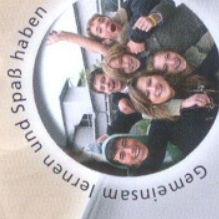
Gemeinsam lernen und Spaß haben