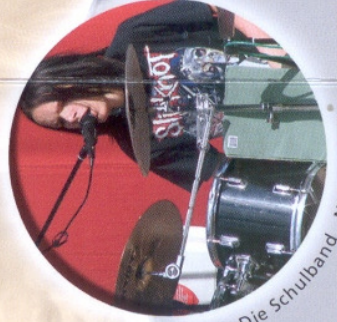
Die Schulband „Nonames“